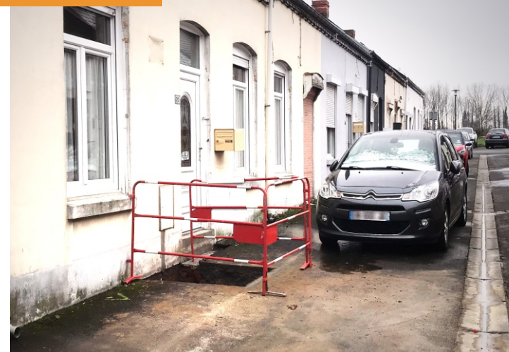
Passerelle de chantier SOLIDEBLOC